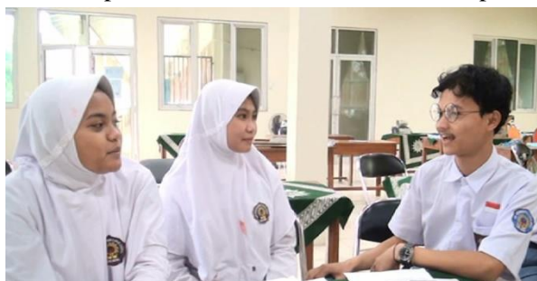
Gambar 4: Siswa berkenalan dengan siswa lainnya di dalam kelompok kecil.