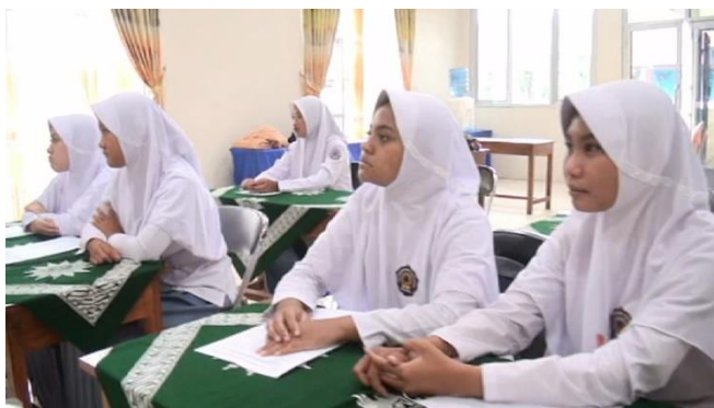
Gambar 2: Siswa melihat video perkenalan diri

Pada tahap ini, guru melaksanakan pembelajaran sesuai dengan lesson design. Siswa diberi apersepsi tentang pentingnya bisa berkenalan dengan seseorang dengan bahasa Inggris. Kemudian siswa menyimak video perkenalan diri yang telah di siapkan guru.