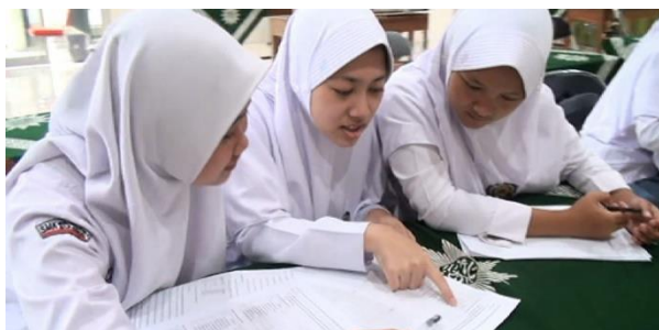
Gambar 3: Siswa dalam kelompok kecil berdiskusi membuat teks perkenalan diri

Siswa kemudian menyebutkan informasi apa saja yang ada pada video tersebut. Video perkenalan diri tersebut menjadi contoh siswa untuk menulis perkenalan diri sendiri. Kemudian siswa dibagi menjadi kelompok kecil. Dalam kelompok ini, siswa berdiskusi menulis teks perkenalan dirinya masing – masing. Setelah itu, siswa saling berkenalan satu sama lain dalam kelompok kecil.