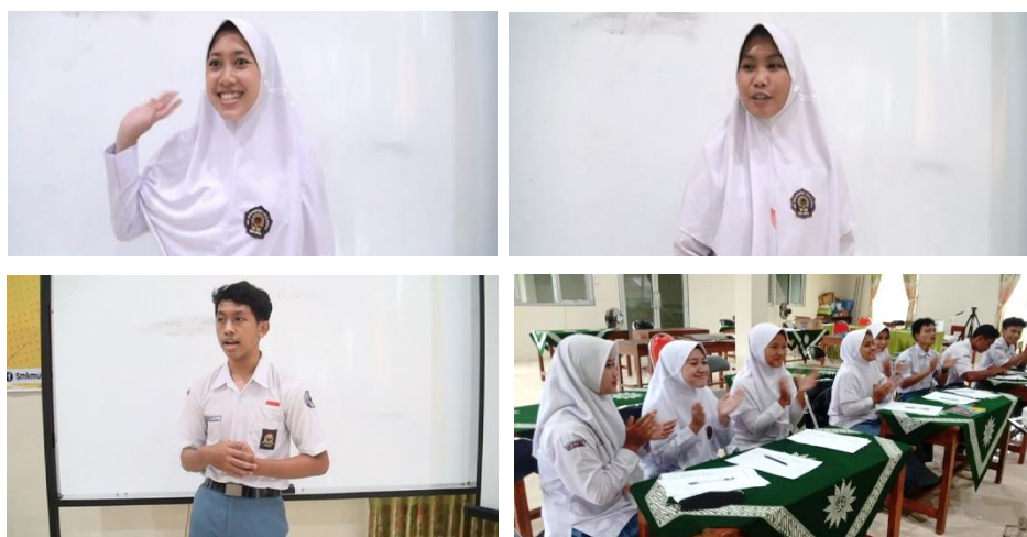
Gambar 5 : Siswa memperkenalkan diri di depan kelas.

Setelah semua siswa berkenalan dalam kelompok kecil, setiap siswa maju ke depan kelas untuk berkenalan. Pada tahap ini, tingkat kepercayaan diri siswa sudah meningkat karena sudah berlatih berkenalan diri dalam kelompok kecil.