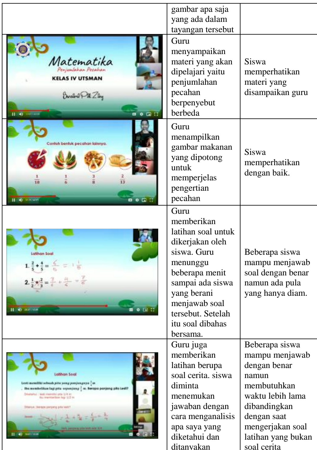
Gambar 4. Implementasi kegiatan pembelajaran bersama siswa

Analisis karakter kemampuan berpikir kritis yang dimiliki siswa pada tahap proses pembelajaran :