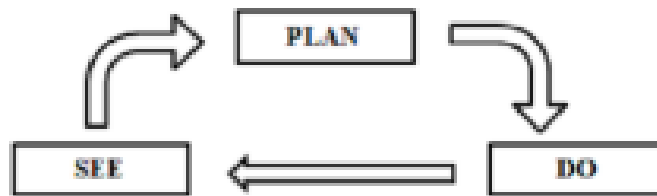
Gambar 1. Alur tahapan lesson study

Metode penelitian yang dilakukan adalah pendekatan kualitatif dengan metode analisis deskriptif. Kegiatan lesson study terdapat 3 tahap plan, do, see melalui pendekatan inkuiri. Subjek penelitian adalah siswa kelas IV SD Mapans Tahun Pelajaran 2021/2022. Teknik pengambilan data melalui metode dokumentasi, wawancara dan diskusi, serta catatan lapangan. Observer pada penelitian ini adalah dosen Unimus, guru, dan Kepala Sekolah SD Mapans. Penilaian lebih diarahkan pada perubahan perilaku yang terjadi pada peserta didik. Data dari hasil observasi dikelompokkan kemudian dianalisis sesuai kebutuhan. Alur penerapan lesson study dapat dilihat pada gambar di bawah ini :