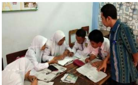
Gambar 6. Guru membimbing diskusi dan memberi penguatan