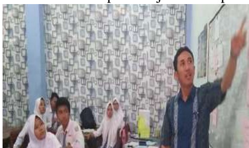
Gambar 4. Memberikan penjelasan prosedur langkah-langkah pembelajaran

Kegiatan yang dilaksanakan pada tahap pelaksanaan adalah melaksanakan langkah-langkah pembelajaran yang telah dibuat sesuai RPP pada materi isotope, isobar dan isoton. Pada siklus 2 dilakukan dengan mengulang pembelajaran dengan memberikan informasi lebih detail langkah-langkah pembelajarannya dan dengan memodifikasi model pembelajaran Group Investigation dengan.