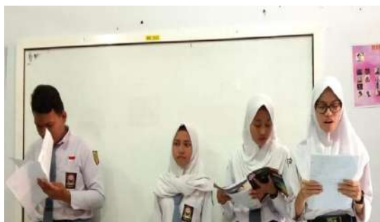
Gambar 3. Peserta didik melakukan presentasi kelompok di depan kelas dan kelompok lain aktif menanggapi