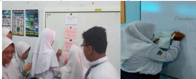
Gambar 5. Semangat dan antusias peserta didik dalam pembelajaran

Pada siklus kedua terjadi peningkatan hasil belajar siswa, yaitu lebih dari 85% peserta didik telah mencapai KKM. Hal ini dapat terjadi karena guru telah mengadakan perbaikan pembelajaran atau modifikasi model Group Investigation. Dari hasil siklus II menunjukkan peningkatan aktivitas dan hasil belajar peserta didik, dengan demikian tidak perlu diadakan siklus ke III.