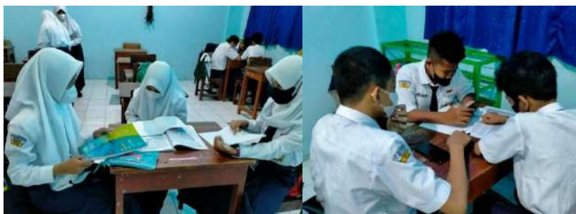
Gambar 2. Peserta didik melakukan investigasi dari referensi buku dan browsing internet

Hasil pengamatan (observasi) pada tahap ini, terjadi perilaku positif peserta didik dalam pembelajaran. (1) Muncul rasa ingin tahu yang besar dari peserta didik untuk menemukan jawaban dari permasalahan. (2) Peserta didik terlihat mempunyai daya juang yang tinggi dalam melakukan investigasi